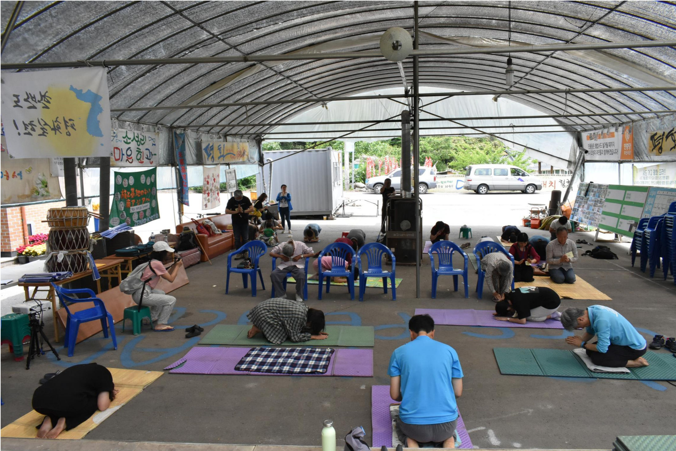
毎日午前 11時 _ 平和百拝