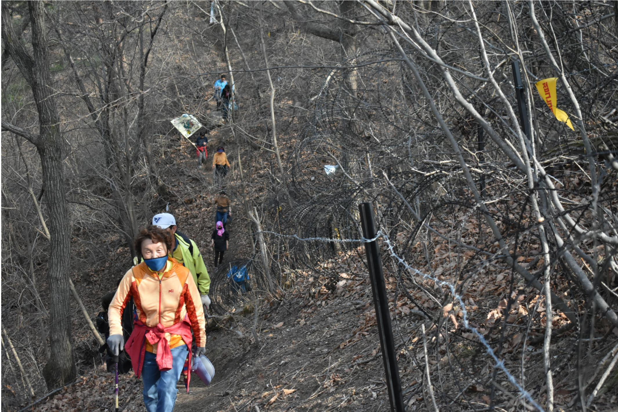
不定期の活動 _ サード基地周辺の山道を歩く平和行動