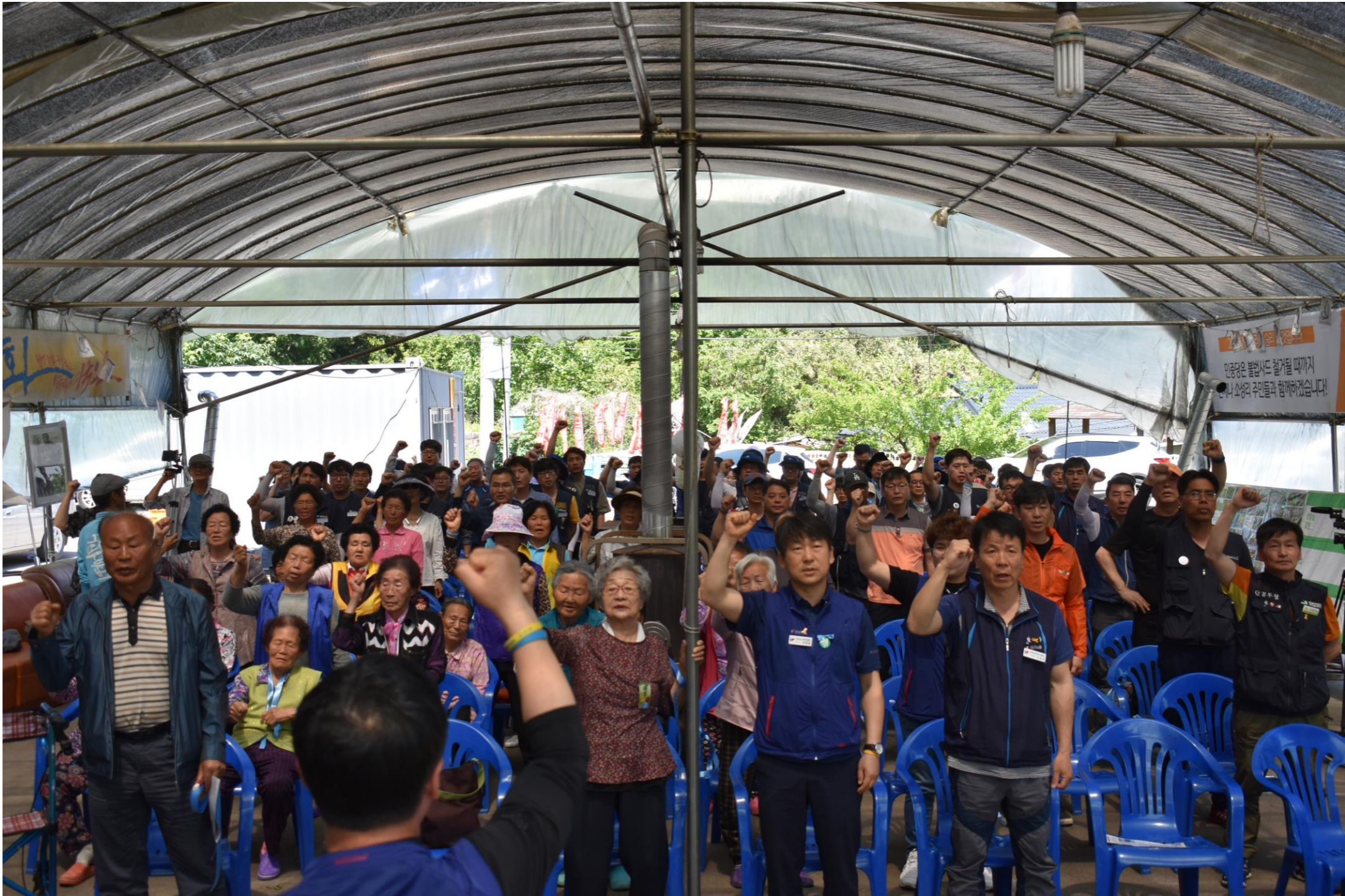
毎週水曜日 午後 2時 _ ソソン里水曜集会(連帯集会)