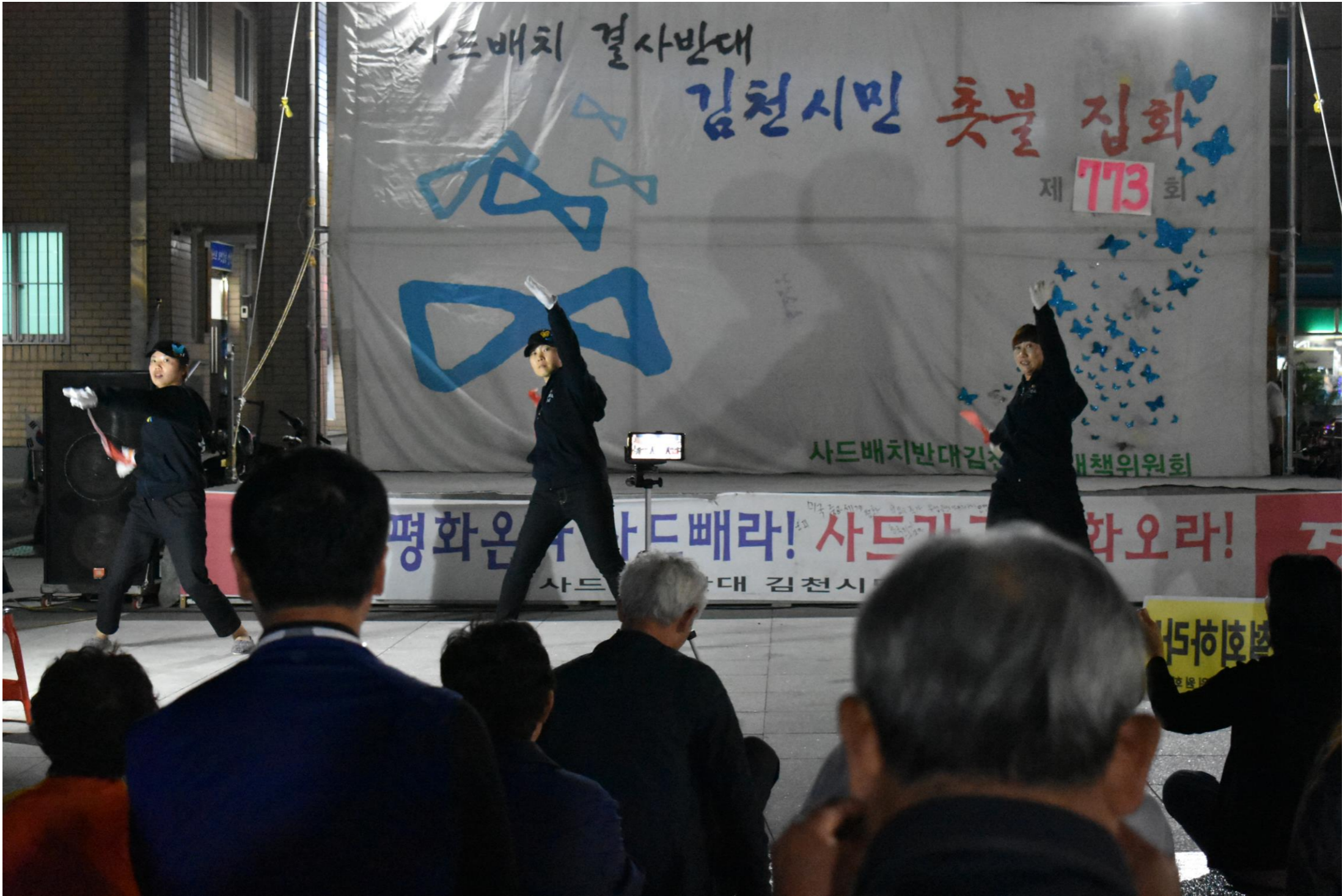
毎週水曜日・日曜日の午後 8時 _ 金泉市民のロウソク集会(金泉駅広場)