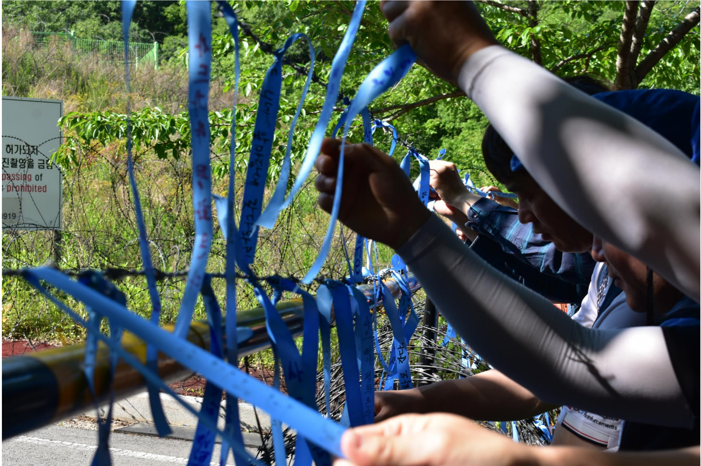
毎日午後 3時 30分 _ サード基地正門前の午後の平和行動