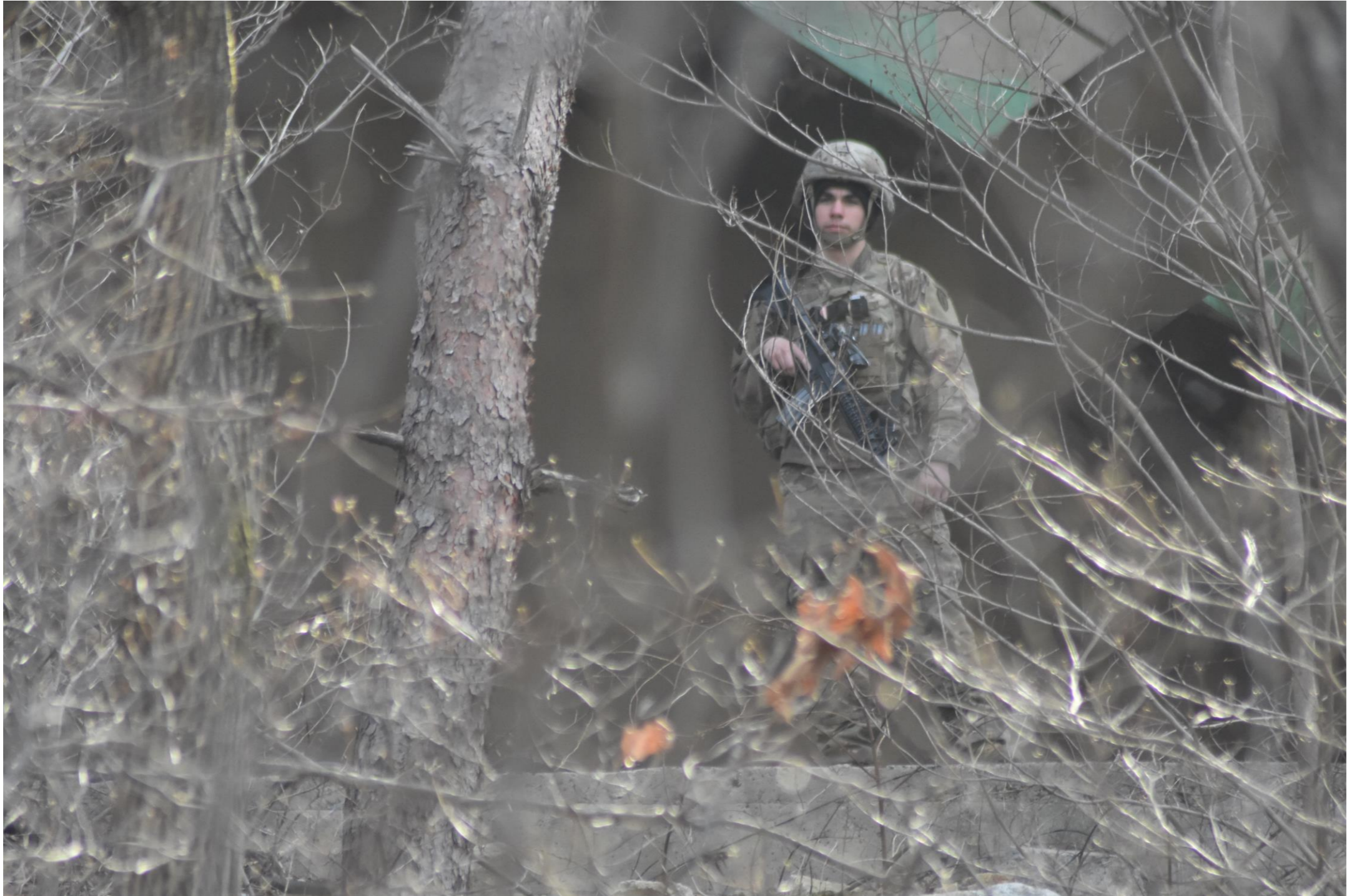
不定期の活動 _ サード基地周辺の山道を歩く平和行動