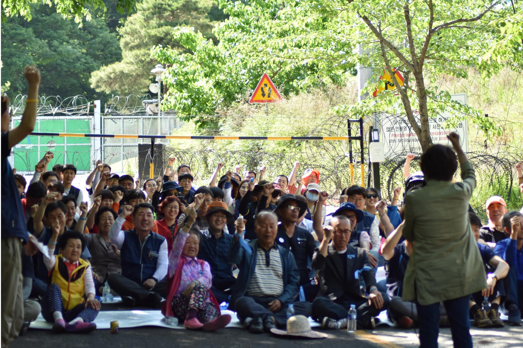
毎日午後3時 30分 _ サード基地正門前の午後の平和行動