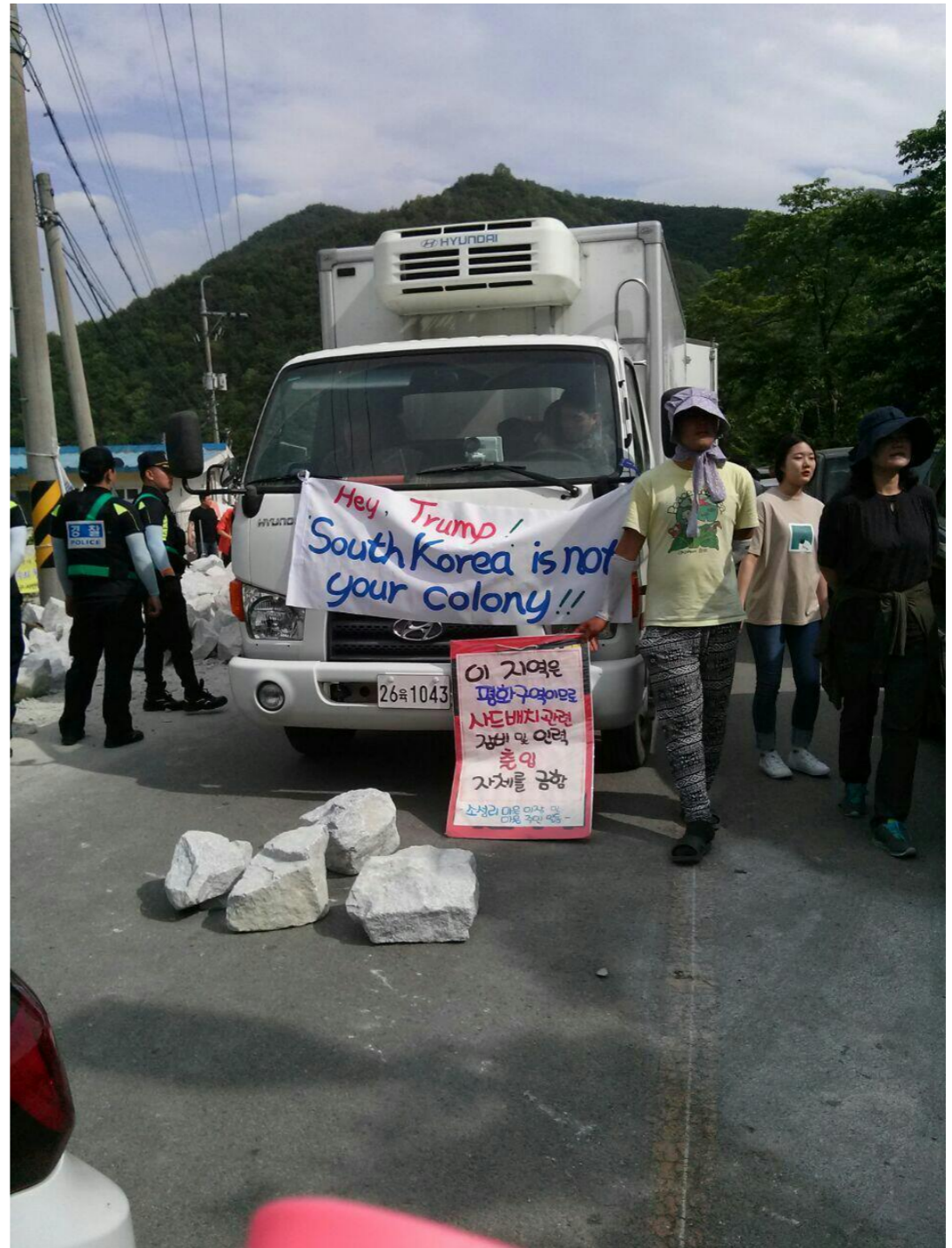
2017.05.04 _ 燃料搬入摘発・阻止闘争 _ 発見された燃料と阻止中の市民たち