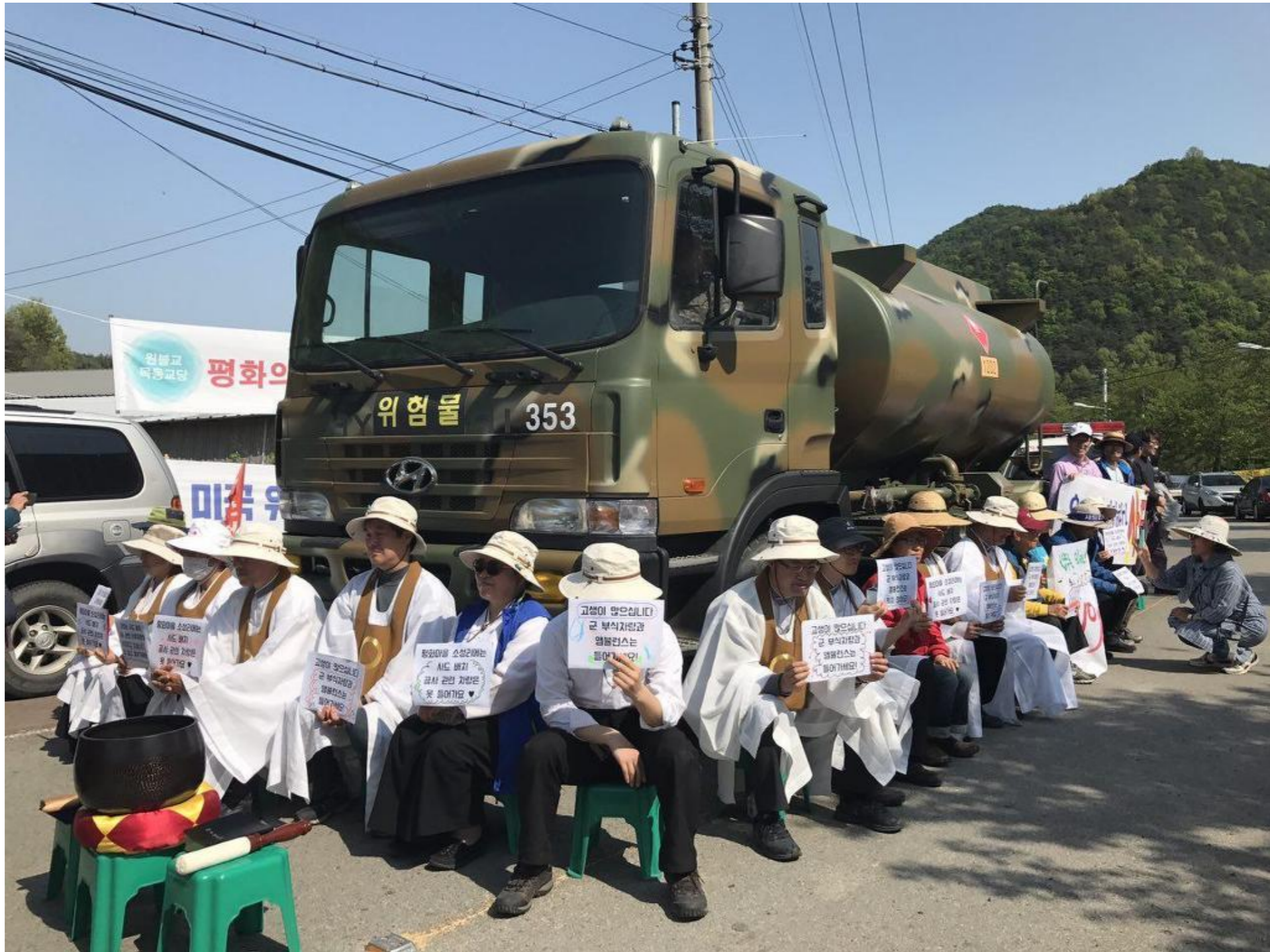
2017.04.23 _ オイルタンク車両阻止闘争 _ 車両を取り囲んで搬入を阻止する姿