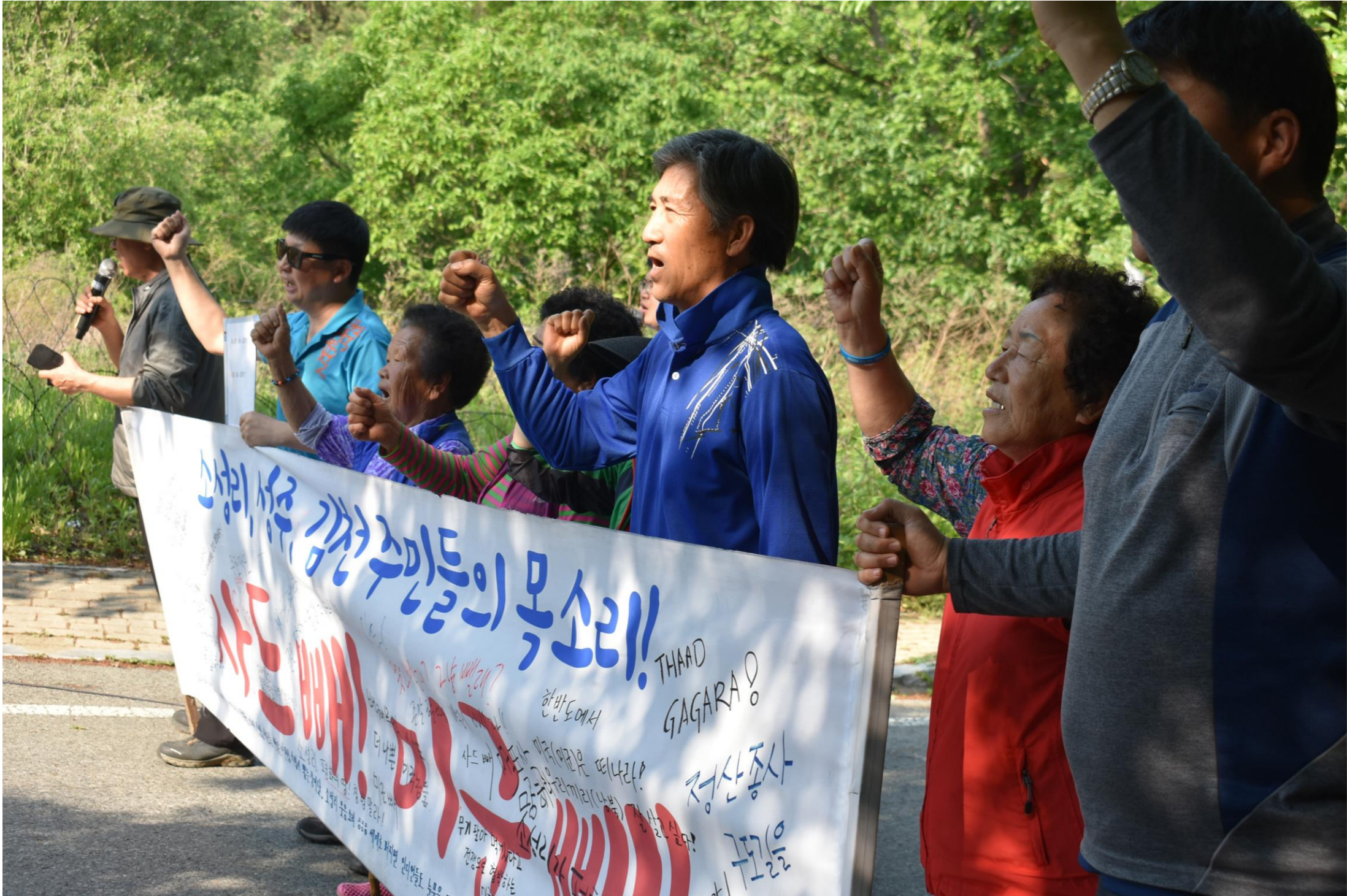
毎日午後 3時 30分 _ サード基地正門前での午後の平和行動