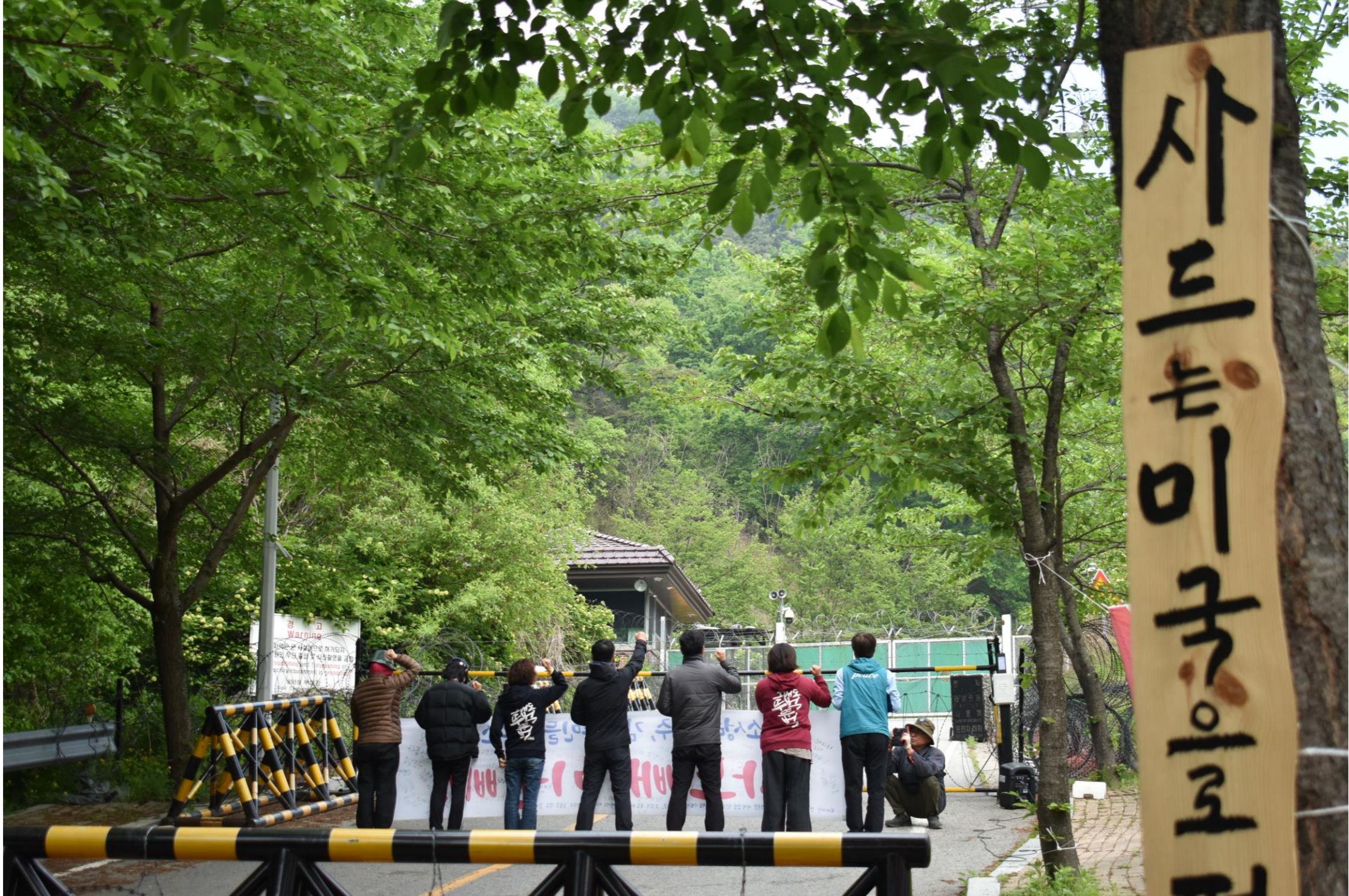
毎日午前 7時 30分 _ サード基地正門前の午前の平和行動