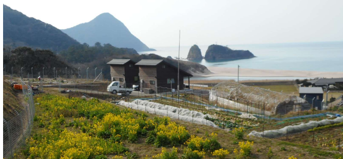
海なごむ のぐさ 野草が芽吹く 京丹後

日程 3月25日(金) 午前8時30分 4月8日(金) 午前8時30分 4月27日(水) 午前8時30分 集合 五条大橋西詰ガソリンスタンド前 * 参加を希望される方は事前に連絡をお願いします。(池田: 090-7108-5508)