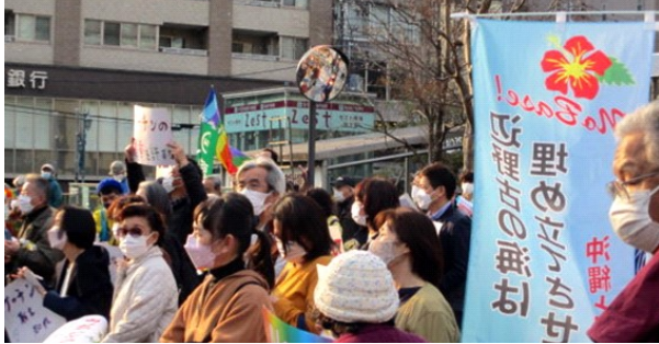
京都市役所前 参加者集会

この日、緊急行動にもかかわらず集会参加者は、主催者発表で210人、デモには約250人。