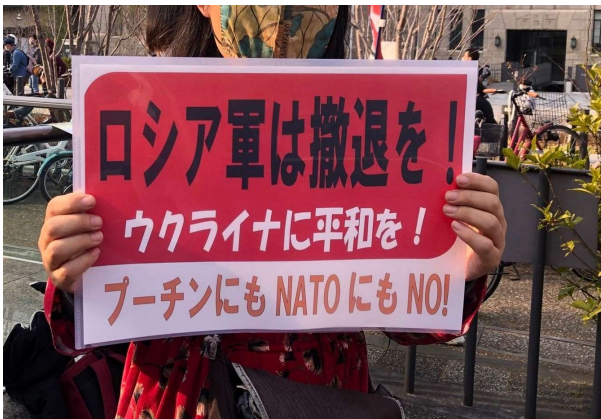
3.12集会で「京都連絡会」が掲げたプラカード

2月24日に始まったロシアによるウクライナ侵攻について、米軍 X バンドレーダー基地反対・京都連絡会は声明を発表している。