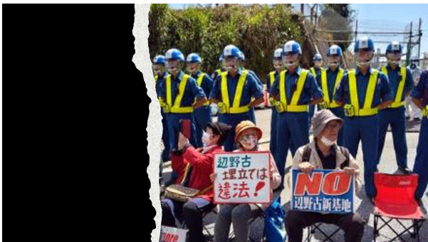
辺野古 キャンプ・シュワブゲート前で座り込み

10時半ちょっと前に到着。第4ゲートの変容ぶりを見せてもらう。生い茂っていた木々は伐採され道路側から大浦湾を望める。弾薬庫も拡張されているのが見える。胸が痛い。すぐにトラックが入るそうでゲート前に立つ。わずかな時間で排除され20台弱のトラックが入っていった。その後テントに戻り参加者の発言が続く。そんな時トラックが入るとゲート前へ簡易のいすを持って座り込む。路上にはトラックが長い列をつくって待機している。少しでも時間かせぎをしたいので、それぞれが警察官に抵抗するがあつという間に排除された。トラックが入っていくのをボードを持って抗議する。帰りのバスの時間が迫ってき、挨拶をしてバス停へ向かい辺野古行動を終える。