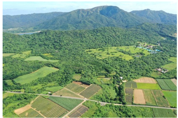
建設前の於茂登岳麓 平得大俣地区

那覇空港から一時間で石垣空港到着。きれいに刈り込まれた街路樹が両サイドに続く道、「白保」のバス停を通過しながら市街地に到着。