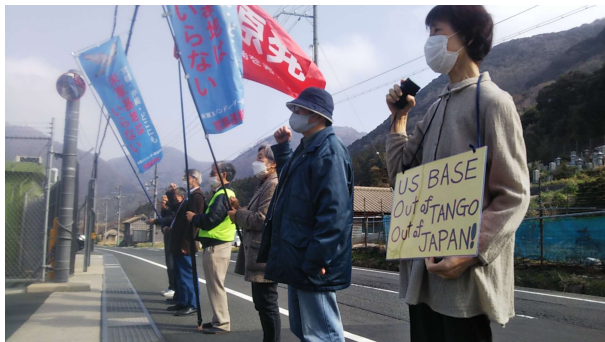
ゲート前での抗議

岸田政権の戦争政策は、東アジアの緊張をあり、米軍 X バンドレーダー基地のさらなる強化をもたらします。基地の監視体制も強まっています。軍事優先の社会では、住民の「安全・安心」は犠牲にされます。昨年 11 月の網野町三津での米軍関係車両による人身事故の隠ぺい問題は、米軍・防衛局の住民軽視の姿勢をあらためて示しました。京丹後市も住民を守るための責任ある行動をとっていません。