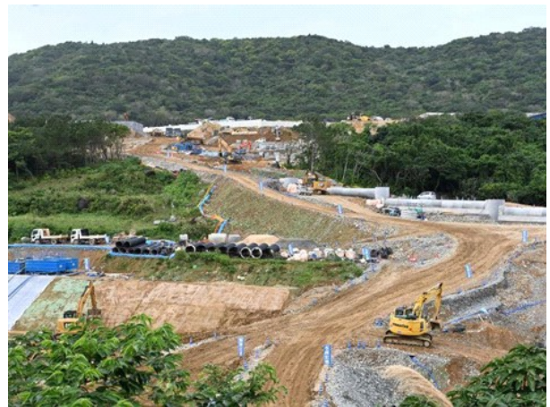
3月16日工事完了18日ミサイル弾薬搬入突貫工事中

14時から東京から来たY、Iさんのレンタカーに同乗し現地案内のパンナ公園に集合し、受付を済ませ渡り鳥観察所の高台に。ここから新しく建設されている陸上自衛隊石垣駐屯所(仮称)全貌を見、規模の大きさに驚く。