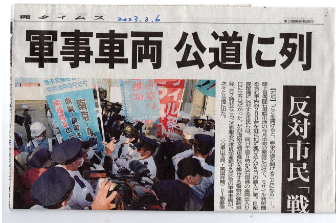
中央の幟が「京都連絡会」の幟です。

石垣島の「市民団体」からの「島々を戦場にさせない!全国集会」のよびかけに添えて・・