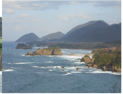
基地建設予定地近くにある袖志の集落 海上から見た穴文殊（基地建設予定地） 丹後松島と呼ばれる宇川の海岸線