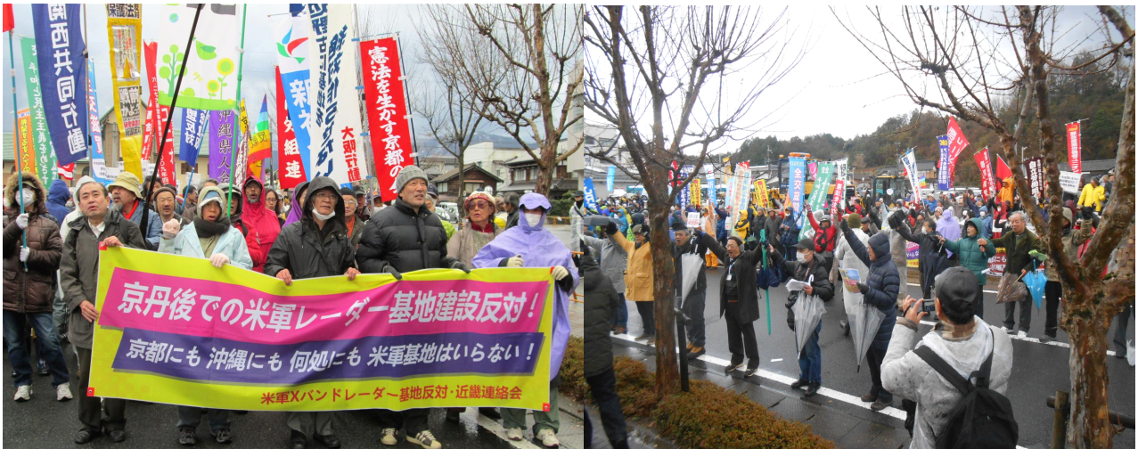
2013年12月15日の京丹後市役所前での「平和のさけび&人間の鎖」